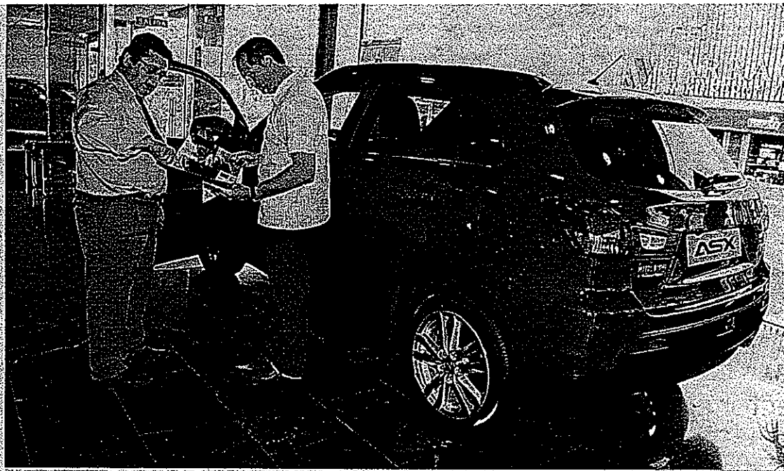
Un cliente solicitando información sobre el nuevo modelo.

Prestaciones sí, pero respetando el medioambiente. Fiel al compromiso medioambiental de Mitsubishi Motors, plasmado a la perfección en su innovador vehículo eléctrico i-MiEV, esta mecánica diésel de bajas emisiones se complementa con la tecnología Clear-Tec de MMC que equipa de serie toda la gama ASX y que cuenta entre otros con sistemas Automatic Stop & Go, regeneración de la fuerza de frenado, neumáticos de baja resistencia a la rodadura... un